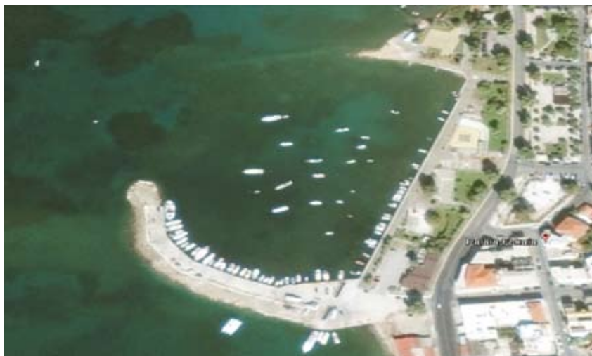
Στη φωτογραφία του Google Earth, διακρίνεται το ίχνος του λιμενοβραχίονα που έκλεινε από τον βοριά το αρχαίο λιμάνι της Αναφλύστου και είχε κατασκευαστεί το 600 π.χ.

Αν δοθεί το «πράσινο φως», τότε οι εργασίες θα επαναληφθούν μετά το καλοκαίρι, αφενός γιατί σε περίπτωση έναρξης εκκαφών θα δημιουργηθεί αναστάτωση στις παραλίες του όρμου στη μέση της τουριστικής περιόδου και αφετέρου γιατί η Τεχνική Εταιρεία απέσυρε τον πλωτό εκσκαφέα, ο οποίος μεταφέρθηκε σε άλλη περιοχή για να εκτελέσει προγραμματισμένες εργασίες, όπως ειπώθηκε.